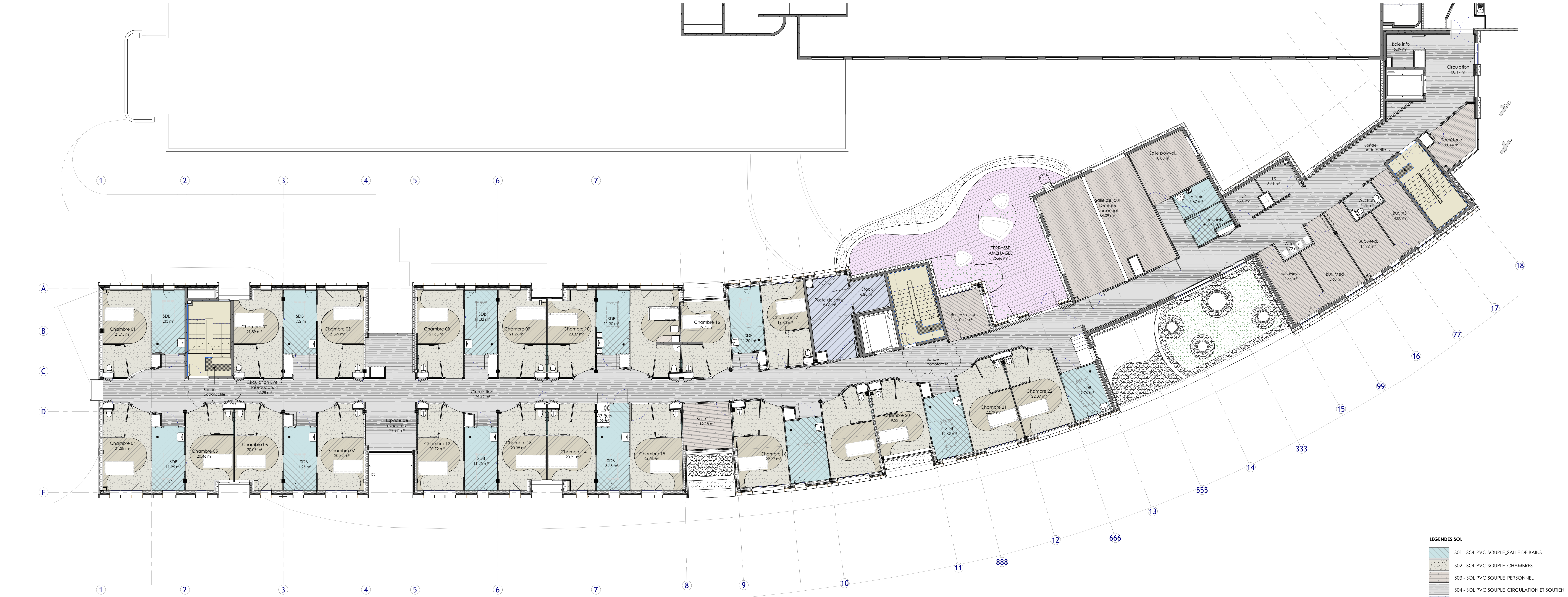
1 | 06_LIV_R+3 PLAN GENERAL DE REPERAGE DE SOL PROJET Ech : 1 : 100